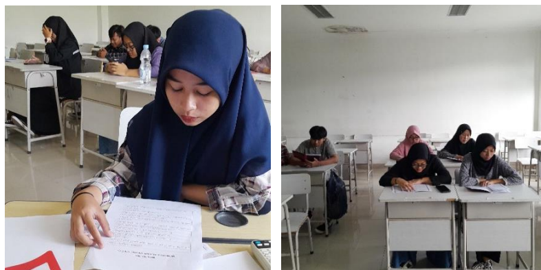
Gambar 2. Dokumentasi kegiatan matrikulasi

Setelah mengikuti kegiatan matrikulasi selama tujuh pertemuan, berikut perkembangan kemampuan membaca Al-Qur'an peserta: