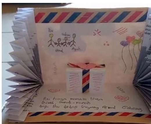
Gambar 5. Media pop up book sebagai media literasi

Selanjutnya pada tahap monitoring, untuk kegiatan pelatihan adalah melakukan pembimbingan dan monitoring terhadap peserta dalam setiap kelompok untuk menerapkan media literasi dalam kegiatan belajar di kelas. Pembimbingan dan monitoring tersebut dilakukan via WhatApps Group (WaG) dengan tim PkM dan peserta. WaG digunakan sebagai sarana guru dalam mengirimkan progran pembuatan dan aplikasi media literasi yang dikembangkan dikelasnya. Berikut ditampilkan Gambar 5 hasil media literasi yang digunakan di salah satu peserta PkM.