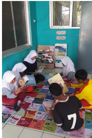
Gambar 6. Kebermanfaatan pojok baca

disediakan di kelasnya. Peserta didik umumnya menggunakan pojok baca ketika jam istirahat seperti yang ditampilkan pada Gambar 6.