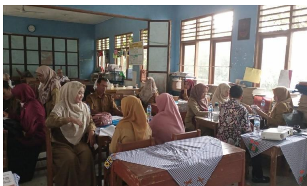
Gambar 3. Proses pelatihan pembuatan media literasi

Pada tahap pelaksanaan kegiatan pelatihan dilakukan dengan pemberian materi mengenai literasi supaya peserta mampu memahami konsep literasi dan kemampuan literasi yang lain. Setelah itu, peserta juga diberikan gambaran berbagai media literasi yang dapat diterapkan di sekolah dasar. Berikut ditampilkan gambar kegiatan pelatihan pembuatan media literasi yang dilakukan.