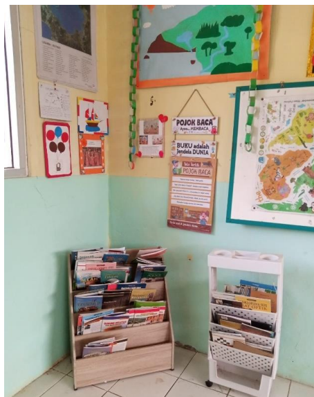
Gambar 4. Pojok baca SD Negeri Tegal Jaya 01

Selanjutnya pada tahap monitoring, untuk kegiatan pelatihan adalah melakukan pembimbingan dan monitoring terhadap peserta dalam setiap kelompok untuk menerapkan media literasi dalam kegiatan belajar di kelas. Pembimbingan dan monitoring tersebut dilakukan via WhatApps Group (WaG) dengan tim PkM dan peserta. WaG digunakan sebagai sarana guru dalam mengirimkan progran pembuatan dan aplikasi media literasi yang dikembangkan dikelasnya. Berikut ditampilkan Gambar 5 hasil media literasi yang digunakan di salah satu peserta PkM.