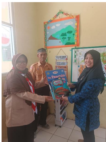
Gambar 2. Alat dan bahan untuk pojok baca

Pada tahap pelaksanaan kegiatan pelatihan dilakukan dengan pemberian materi mengenai literasi supaya peserta mampu memahami konsep literasi dan kemampuan literasi yang lain. Setelah itu, peserta juga diberikan gambaran berbagai media literasi yang dapat diterapkan di sekolah dasar. Berikut ditampilkan gambar kegiatan pelatihan pembuatan media literasi yang dilakukan.