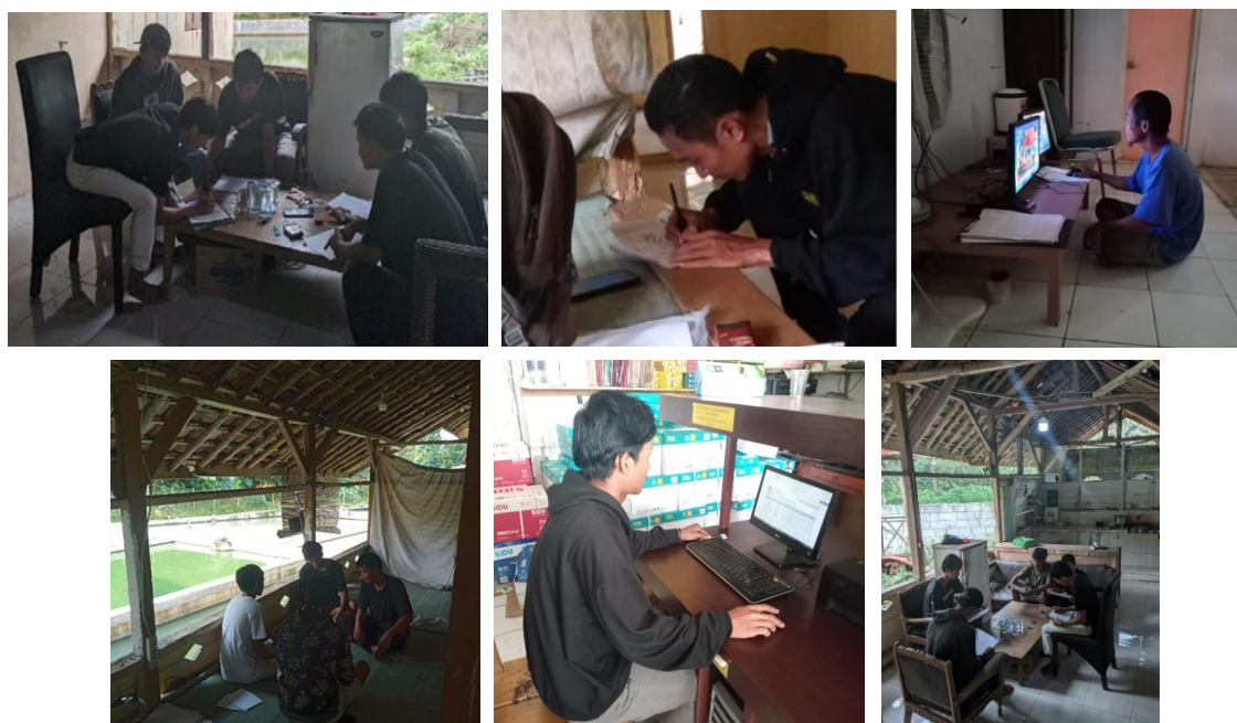
Gambar 5. Kegiatan pelaksanaan PKM