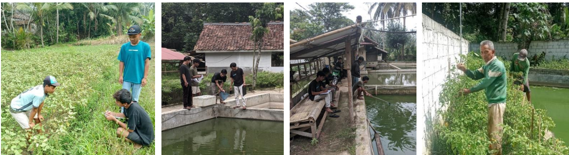
Gambar 4. Kegiatan survey lapangan