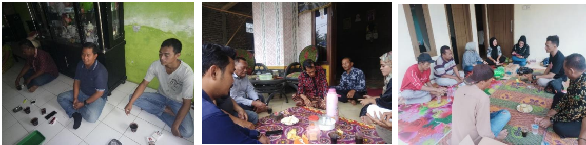
Gambar 3. Kegiatan survey pendahuluan dan observasi UMKM