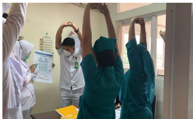
Gambar 2. Praktik perengangan bersama perawat

Edukasi dilakukan dengan melakukan praktik perengangan di tempat kerja dan pemberian materi pencegahan penyakit akibat kerja kepada para perawat. Peningkatan kesadaran perawat terkait universal precaution juga dilakukan seperti mengedukasi untuk mencuci tangan sesuai standar WHO (5 moment mencuci tangan). Menurut penelitian, pengetahuan merupakan faktor predisposisi dari perilaku penerapan keselamatan dan kesehatan kerja, dimana semakin baik pengetahuan seseorang tentang K3, maka perilaku tentang keselamatan dan kesehatan kerja juga semakin baik (Purnawinadi & Ludji, 2019)