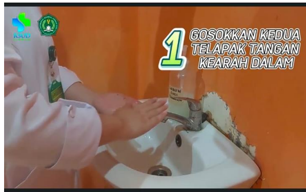
Gambar 3. Edukasi 6 benar cuci tangan melalui video

Setelah dilakukan edukasi kemudian pada akhir minggu ke 2 dilaksanakan evaluasi untuk mendapatkan gambaran perilaku perawat dalam praktik penerapan pengurangan resiko infeksi yang dapat dilihat melalui tabel berikut: