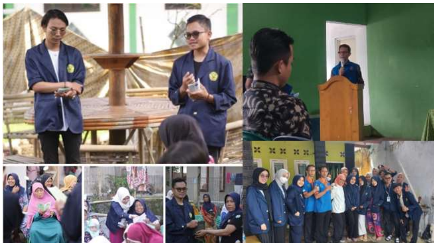
Gambar 5. Foto Kegiatan Sosialisasi

Kegiatan ini diawali dengan pembukaan oleh moderator, kemudian dilanjutkan dengan pembagian brosur lalu dilanjutkan dengan pemaparan materi mengenai tanaman obat keluarga, macam-macam jenis tanaman obat keluarga, dan cara penggunaannya. Setelah dilakukan pemberian materi selanjutnya dilakukan dengan pengisian kuesioner evaluasi mengenai materi yang telah disampaikan. Foto kegiatan sosialisasi dan edukasi dapat dilihat pada Gambar 5 .