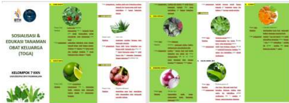
Gambar 4. Brosur Tanaman Obat Keluarga

Kegiatan ini memiliki tujuan untuk meningkatkan pengetahuan masyarakat dan memiliki keterampilan dalam pemanfaatan tanaman obat keluarga. Kegiatan ini diawali dengan pembukaan oleh moderator, kemudian dilanjutkan dengan pembagian brosur mengenai macam-macam tanaman obat, setelah itu dilakukan pemaparan materi. Pemaparan materi berisi mengenai definisi tanaman obat keluarga, manfaat tanaman serta cara memanfaatkan tanaman agar dapat dijadikan obat seperti bahan-bahan yang digunakan dan cara pengolahannya. Gambar 4 berikut.