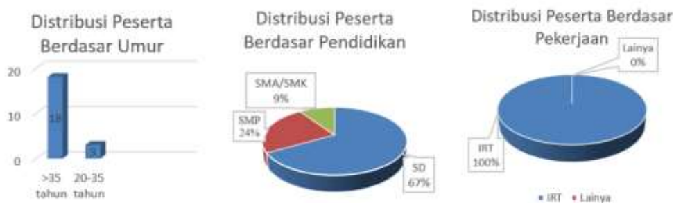
Gambar 3. Distribusi Peserta Sosialisasi TOGA

Kegiatan pengabdian masyarakat ini dilaksanakan secara tatap muka atau langsung oleh mahasiswa kelompok 7, Universitas Bakti Tunas Husada pada hari Kamis tanggal 30 Juni 2022 di halaman rumah salah satu warga Desa Sirnaputra, Jl. Kadupugur, Sirnaputra, Kec Cigalontang, Kab Tasikmalaya, Jawa Barat. Metode pelaksanaan kegiatan ini yaitu sosialisasi dan edukasi tanaman obat keluarga. Sasaran dari kegiatan ini yaitu masyarakat Desa Sirnaputra, Kecamatan Cigalontang, Kabupaten Tasikmalaya, Jawa Barat. Masyarakat yang hadir 21 orang. Distribusi peserta dapat diligat seperti Gambar 3 .