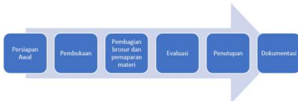
Gambar 2. Diagram alir kegiatan pengabdian masyarakat

Kegiatan pengabdian masyarakat yang dilangsungkan mulai dari persiapan hingga penutupan dirangkum pada diagram alir sesuai Gambar 2 .