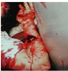
Gambar 1. Luka Terbuka

Perbuatan itu memiliki wujud, kuantitas, kualitas dan intensitas yang tergambar pada bukti. Perbuatan sebagaimana dijelaskan tersebut di atas bukan factor, merupakan akumulasi frame-frame , berlangsung durasi, kecepatan, kekuatan gaya bervariasi dan simultan menyebabkan terbentuknya bukti dengan frakmentasi beranekaragam. Contoh ketika seseorang menusuk tubuh dengan menggunakan pisau, perbuatan menusuk sesungguhnya kumpulan sederetan gerakan dengan kecepatan dan kekuatan yang bervariasi menyebabkan terkoyaknya organ tubuh. Tubuh yang terkoyak oleh kekuatan gaya dengan kecepatan yang bervariasi menghasilkan berbagai bentuk-bentuk sayatan besar, kecil s/d mikron bahkan nanogram. Pada prinsipnya sekecil apapun bukti yang ditemukan tetap membawa sifat alamiah zat/materi seperti wujud, bentuk, berat, struktur, komposisi dan sifat. 22 Sifat bukti yang semacam itu dapat di periksa dan diuji secara kualitatif dan atau kuantitatif.